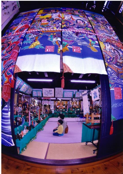
入選 『 端午の節句 』