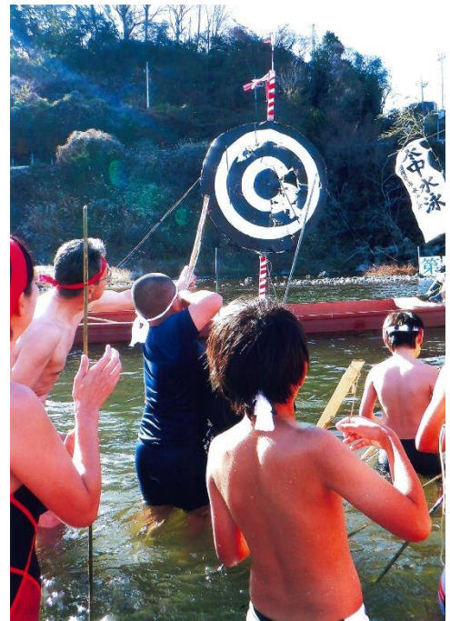
入選 『 いざ、射らん! 』