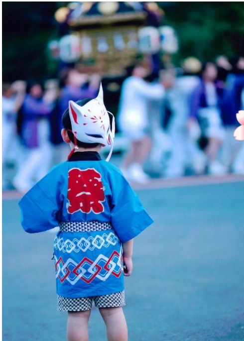
入選 『 いつか きっと ぼくも 』