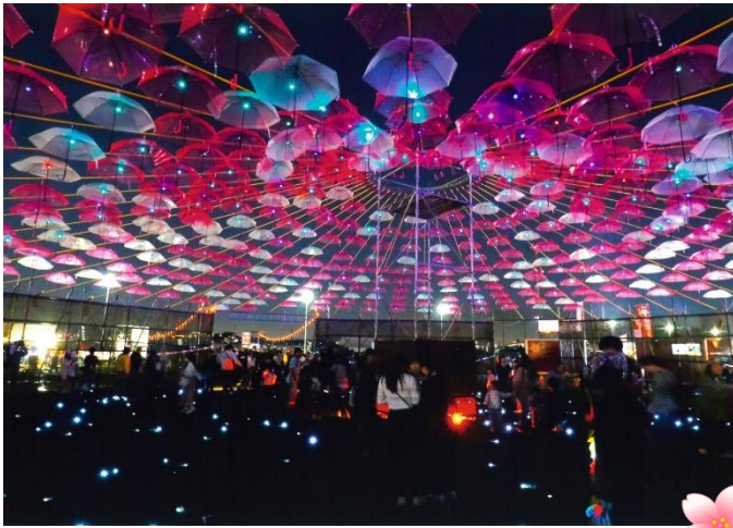
入選 『 アンブレラブlossam 』