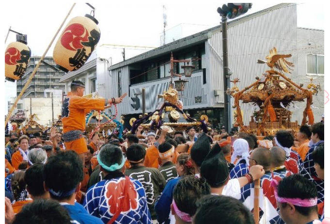
入選 『 出陣 』