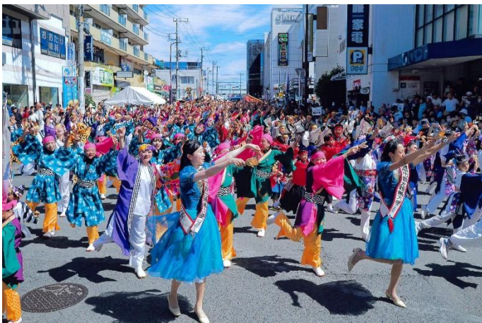
入選 『 みんなで乱舞 』