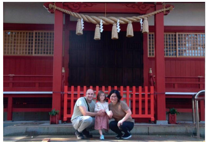
市制 70 周年記念特別賞 『 はじめてのお参り 』